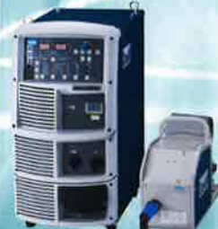
デジタルインバータ型式 CO 2 /MAG自動溶接機 We!bee インバータ M500