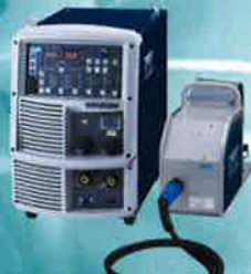
デジタルインバータ型式 パルスMAG/MIG/CO 2 /MAG/MIG自動溶接機 We!bee インバータ P350