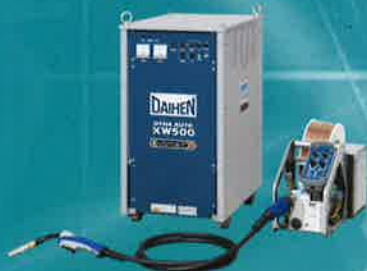
マイコンサイ化タリ型式 CO 2 /MAG自動溶接機 ダイナオート XW500